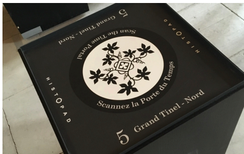
a- Code graphique : la porte du temps

Le Palais des Papes d'Avignon met à la disposition des visiteurs depuis deux ans environ, une tablette nommée Histopad , qui reprend les fonctionnalités d'un audioguide classique, mais qui intègre également des fonctionnalités de Réalité Augmentée. Ce dispositif permet au visiteur de visionner les salles dans lesquelles il se trouve, avec des décors tels qu'ils étaient supposés être au temps des Papes d'Avignon (XIV ème siècle). L'application actuelle déployée dans l'Histopad est basée sur l'utilisation de la caméra dans une phase d'initialisation, pendant laquelle le visiteur doit scanner un code graphique intitulé « la porte du temps », (figure a) puis sur les outils inertiels intégrés à la tablette (gyroscope, accéléromètre) dans un deuxième temps (figure b). Cette approche souffre de deux défauts principaux : d'une part, on observe une dérive temporelle de l'estimation de l'orientation. D'autre part, seuls les trois degrés de liberté en rotation sont estimés.